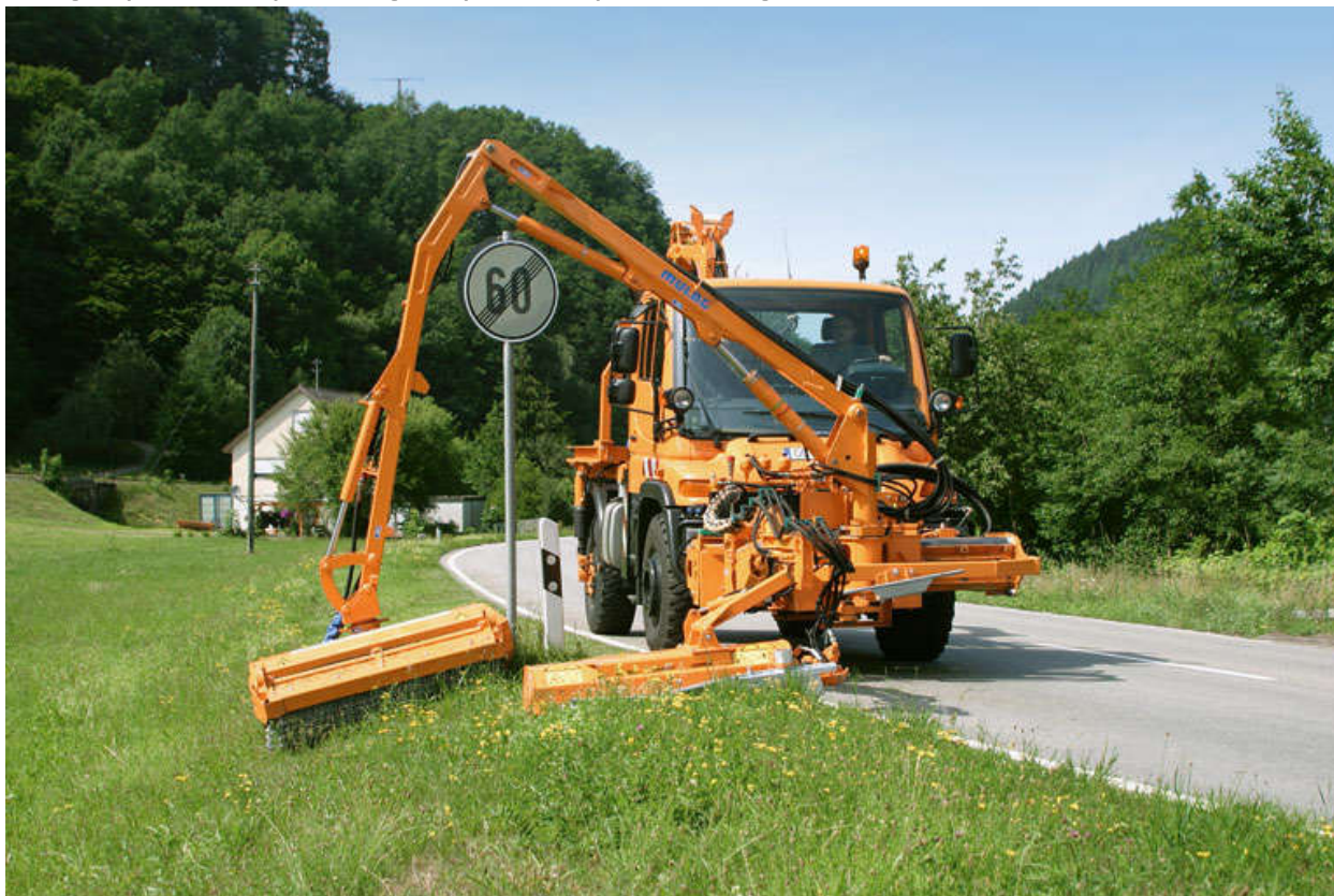
Fotografija 5.2. Primjer nadogradnje za košnju za Unimog

Točka 6. Nabavka kombiniranog stroja za utovar i iskop kakvog već koriste RJ "Prometnice" i "Zelenilo" kao zamjena za dotrajali stroj kojeg smo dosad koristili.